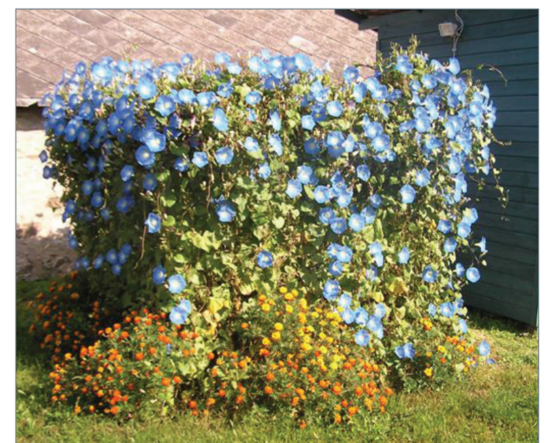
Virággal beültetett komposztsiló